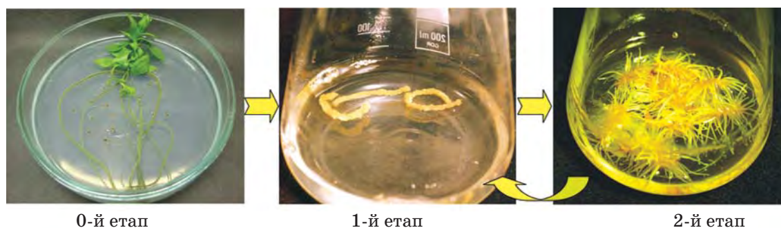
Рис. 1. Схема отримання культури ізольованих коренів тирличів:

де IP — індекс росту за сирою масою, M — маса ізольованих коренів через 4–6 тижнів культивування, m — початкова маса інокулюмів.