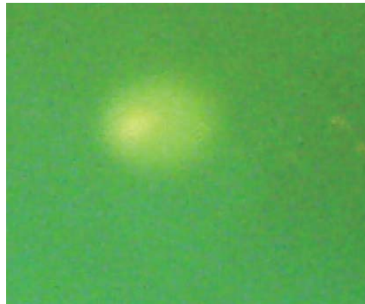
Рис. 3. Електрофоретична картина ушкодженої ДНК («ДНК-комета») клітин селезінки наночастинками розміром 20 нм

У літературі є дані про накопичення золота в селезінці після введення його лабораторним тваринам [9]. Тому вважали за доцільне дослідити ДНК-ушкоджувальну дію наночастинок золота різного розміру в клітинах цього органа. Показано, що наночастинок золота розміром 20 нм спричиняли ушкодження ДНК на рівні 21% за показником «% ДНК у хвості» (за рівня негативного контролю 0,3%). Електрофоретичну картину, що характеризує первинні ушкодження ДНК клітин селезінки, наведено на рис. 3.