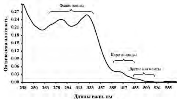
Рис. 2. Спектр поглощения апиэкстракта в этаноле

В спектре поглощения апиэкстрактов (рис. 2) выделяется серия полос в интервале 260–360 нм, типичных для флавонов и флавонолов. Полосы в области 400–425 нм характерны для каротиноидов. И, наконец, в области 430–500 нм видны слабые полосы не идентифицированных пигментов, соответствующих пикам 5 и 6 в 3D-спектрах флуоресценции.